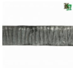
Полоса, арт. 30411П 3000x30x4мм Вес: 2.8 кг Цена (за штуку): 385 руб.