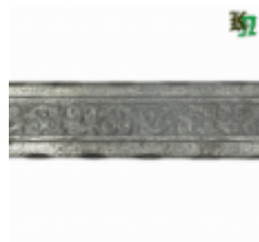
Полоса, арт. 40408П 3000x40x4мм Вес: 3.3 кг Цена (за штуку): 380 руб.