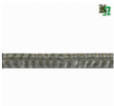
Квадрат, арт. 12Д3 3000мм, кв.12x12мм Вес: 3.43 кг Цена (за штуку): 480 руб.