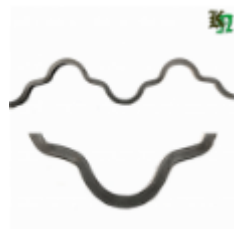
Монастырская вязь, арт. 180 1560мм, кв.12х12мм Вес: 2.26 кг нет в наличии