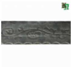
Полоса, арт. 40404П 3000x40x4мм Вес: 4.3 кг Цена (за штуку): 465 руб.