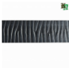
Полоса, арт. 40411П 3000х40х4мм Вес: 4.3 кг нет в наличии