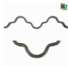
Монастырская вязь, обжатая, арт. 181 1560мм, кв.12х12мм Вес: 2.2 кг нет в наличии