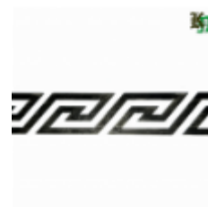
Декоративный прокат, полоса, арт. 820 1200х95х2.5мм Вес: 1.2 кг Цена (за штуку): 480 руб.