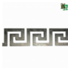
Декоративный прокат, полоса, арт. 827 1200х95х2мм Вес: 1.2 кг Цена (за штуку): 550 руб.