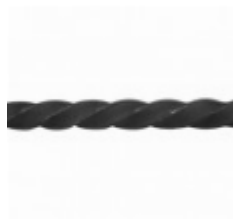
Квадрат, арт. 12Д4 3000мм, кв.12x12мм Вес: 3.45 кг Цена (за штуку): 615 руб.