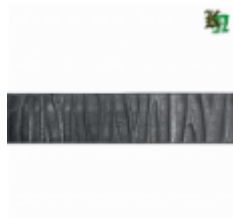
Полоса, арт. 20403П 3000x20x4мм Вес: 2.17 кг Цена (за штуку): 320 руб.