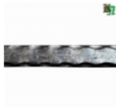
Полоса, арт. 12603П 3000x12x6мм Вес: 1.7 кг Цена (за штуку): 270 руб.