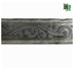
Полоса, арт. 50507П 3000x50x5мм Вес: 5 кг Цена (за штуку): 570 руб.