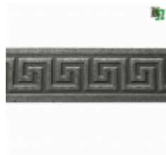
Полоса, арт. 40412П 3000x40x4мм Вес: 4.3 кг Цена (за штуку): 465 руб.