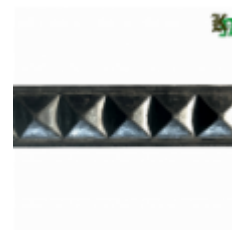
Полоса, арт. 32901П 3000х32х9мм Вес: 3.35 кг нет в наличии