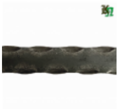
Полоса, арт. 25401П 3000x25x4 Вес: 2.4 кг Цена (за штуку): 330 руб.