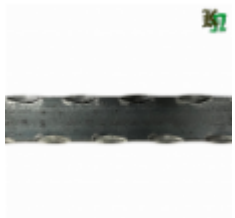
Полоса, арт. 20402П 2930x20x4 Вес: 2.2 кг Цена (за штуку): 320 руб.