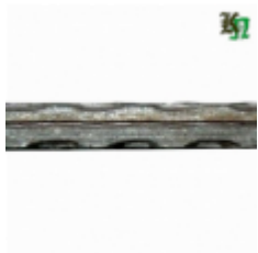
Квадрат, арт. 14Д2 3000мм, кв.14х14мм Вес: 4.4 кг Цена (за штуку): 600 руб.