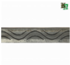
Полоса, арт. 20401П 3000x20x4мм Вес: 2.17 кг Цена (за штуку): 320 руб.