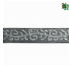
Полоса, арт. 20404П 3000x20x4мм Вес: 2.17 кг Цена (за штуку): 320 руб.