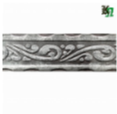
Полоса, арт. 40407П 3000х40х4мм Вес: 4.3 кг нет в наличии