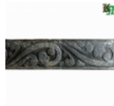
Полоса, арт. 30407П 3000x30x4мм Вес: 2.8 кг Цена (за штуку): 385 руб.