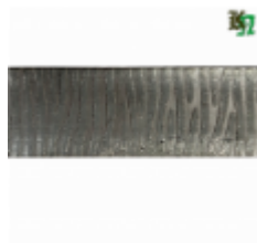
Полоса, арт. 50511П 3000x50x5мм Вес: 5 кг Цена (за штуку): 570 руб.