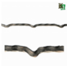
Квадрат для решетки, обжатый, арт. 178 1900мм, кв.12х12мм Вес: 2.14 кг нет в наличии