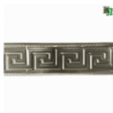
Декоративный прокат, полоса, арт. 412.26 2500х80х1мм Вес: 1.37 кг Цена (за штуку): 650 руб.