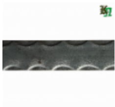
Полоса, арт. 30401П 3000x30x4мм Вес: 2.8 кг Цена (за штуку): 400 руб.