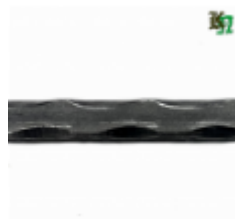
Квадрат, арт. 12Д5 3000мм, кв.12x12мм Вес: 3.43 кг Цена (за штуку): 550 руб.