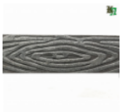
Полоса, арт. 40409П 3000x40x4мм Вес: 4.3 кг Цена (за штуку): 380 руб.