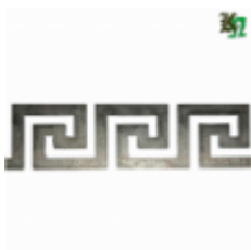
Декоративный прокат, полоса, арт. 826 1200х80х2мм Вес: 1.2 кг Цена (за штуку): 460 руб.