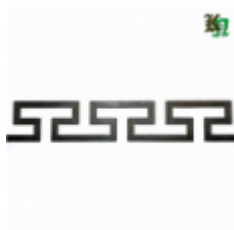
Декоративный прокат, полоса, арт. 824 1200х95х2,5мм Вес: 1.2 кг Цена (за штуку): 490 руб.