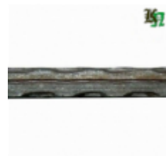
Квадрат, арт. 10Д2 3000мм, кв.10x10мм Вес: 2.38 кг Цена (за штуку): 300 руб.