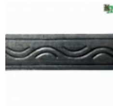
Полоса, арт. 40406П 3000x40x4мм Вес: 4.3 кг Цена (за штуку): 465 руб.