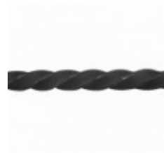
Квадрат, арт. 14Д4 3000мм, кв.14x14мм Вес: 4.4 кг Цена (за штуку): 600 руб.