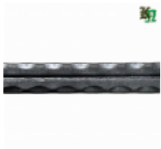
Полоса, арт. 12602П 3000x12x6мм Вес: 1.7 кг Цена (за штуку): 270 руб.