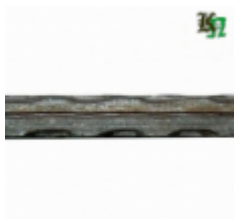
Квадрат, арт. 12Д2 3000мм, кв.12x12мм Вес: 3.43 кг Цена (за штуку): 480 руб.